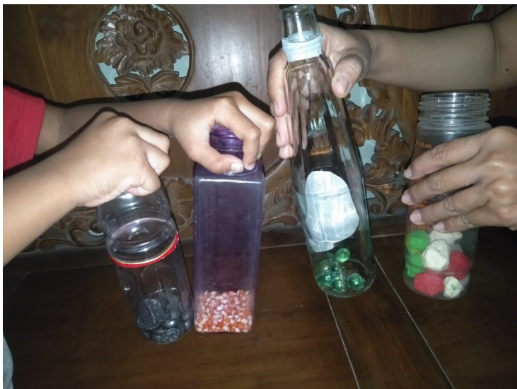
Botol di kocok /digoyang-goyang