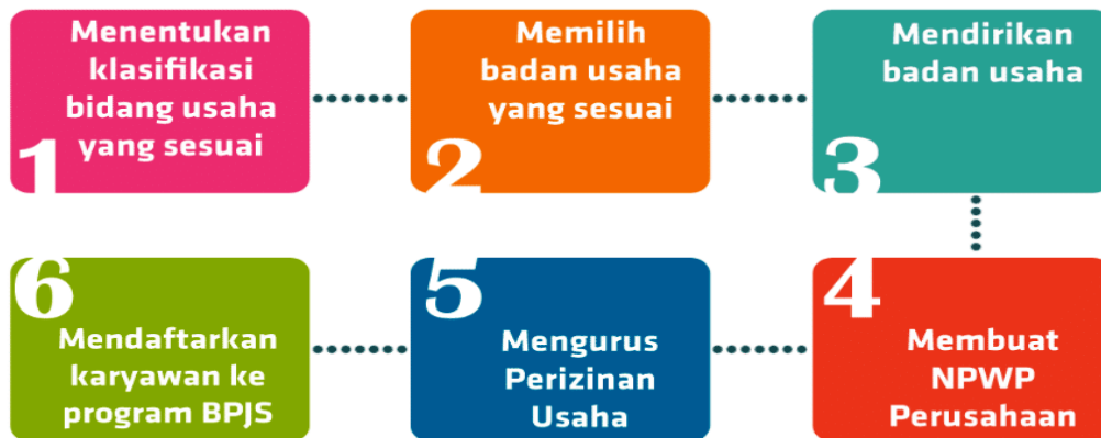
Gambar 1. Panduan Legalitas Usaha

1. Berdasarkan gambar di atas, jelaskan tentang panduan legalitas usaha?