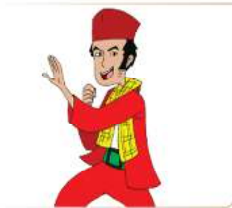
Si Pitung rajin mengaji dan silat.

5. Perhatikan gambar cerita di bawah ini!