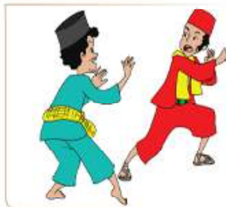
Si pitung gemar berlatih silat bersama teman-temannya.