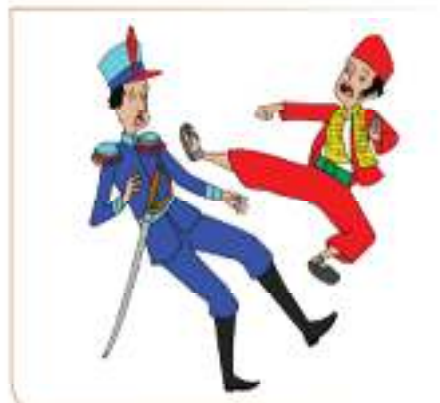
Si Pitung mengeluarkan jurus silatnya untuk melawan kompeni