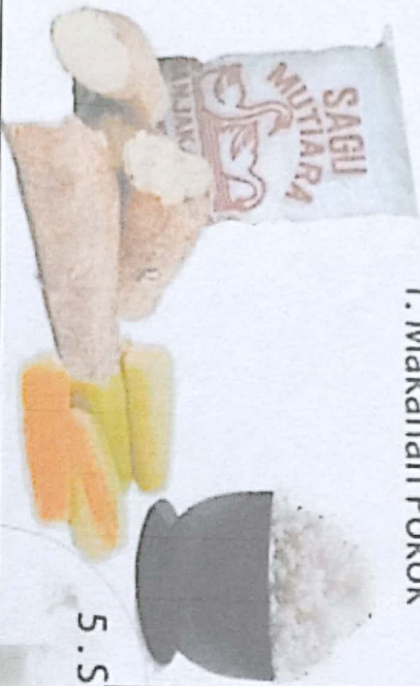
1. Makanan Pokok