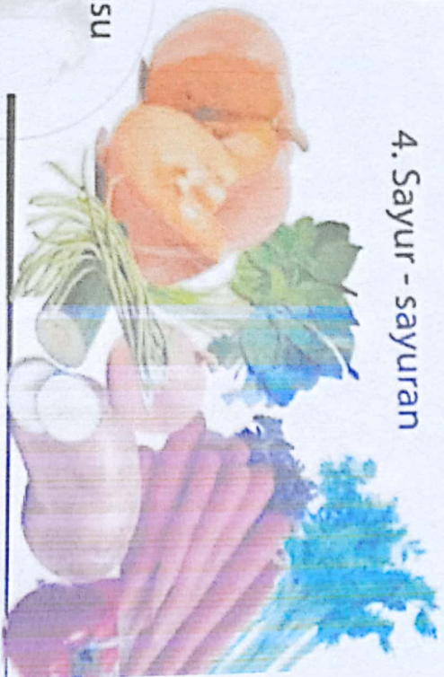
4. Sayur - sayuran