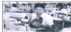
Gambar 2.2 ▲ Pengusaha sebelum memproduksi baju harus menentukan pilihan-pilihan dalam penggunaan faktor-faktor produksi.