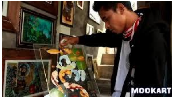
Karya Seni Gelas Lukis Modern/Kekinian