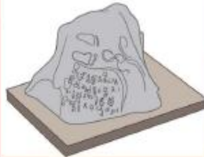
Prasasti Ciareteun, peninggalan Kerajaan Tarumanegara, Bogor