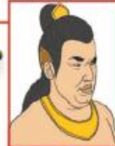
Mahapatih Gajah Mada dan Raja Hayam Wu- ruk, Kerajaan Majapahit