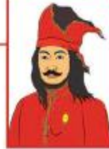
Sultan Hassanudin "Ayam Jantan dari Timur" Kerajaan Gowa-Tallo, Makassar