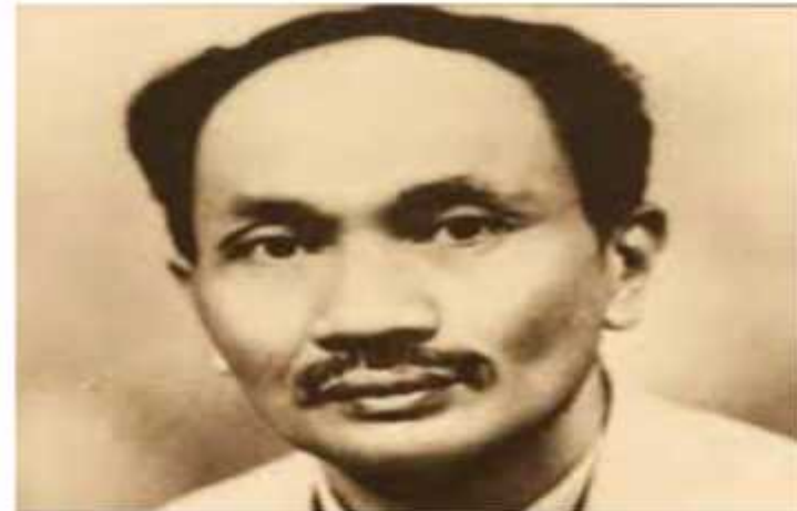
dr. Soetomo