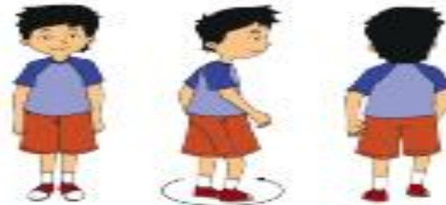
Anak bergerak berputar