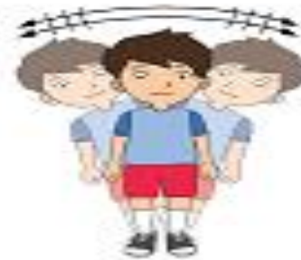
Anak bergerak cepat