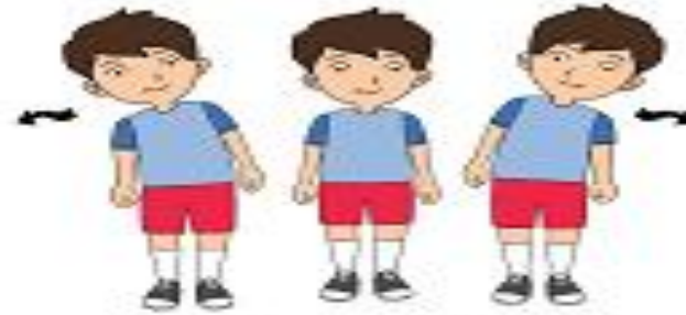
Anak bergerak lambat

Perhatikan gambar berikut! Gerakan angin sepoi-sepoi bergeraklah lemah ke kiri dan ke kanan. Jika angin kencang, bergeraklah dengan hentakan yang kuat ke kiri dan ke kanan. Jika angin puting beliung, bergeraklah berputar.