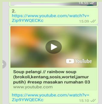
Gambar 2 Vidio cara memasak sayuran