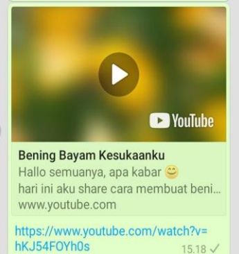
Gambar 1 vidio bercerita sayur kesukaan