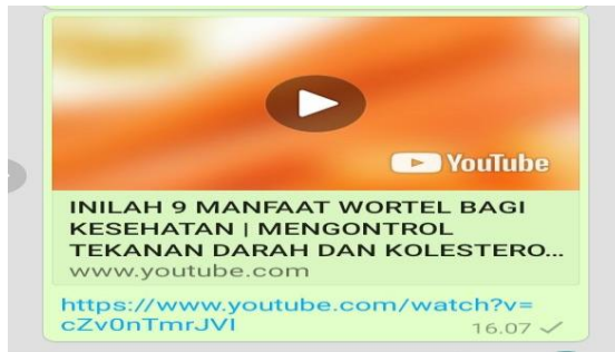
Gambar 1 vidio Manfaat wortel