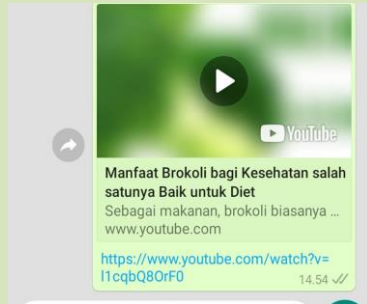
Gambar 1 Vidio manfaat brokoli

Brokoli bermanfaat bagi kesehatan kita, pencegahan berbagai macam penyakit berbahaya