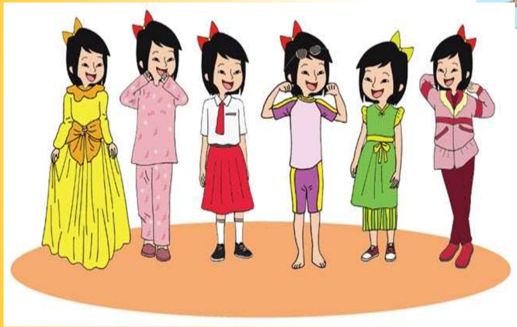
Sebagai perhiasan (fashion)