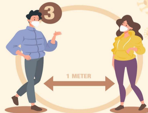
JAGA JARAK FISIK