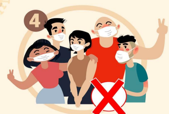
HINDARI DAN JANGAN BIKIN KERUMUNAN