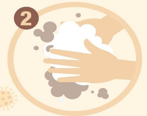
RAJIN CUCI TANGAN