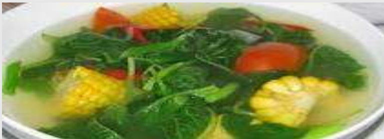
Sayur Bening Bayam