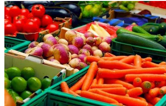
1. Non-durable Goods