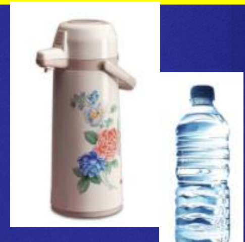
AIR HANGAT/ AIR DINGIN