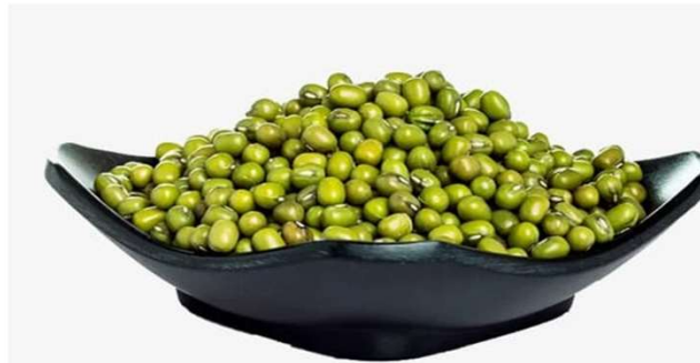
Biji Kacang Hijau