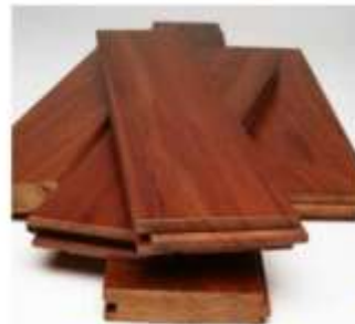
Kayu (benda padat)