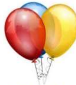
Gas dalam balon