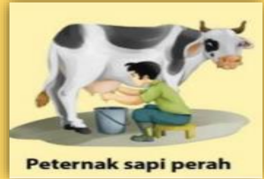
Peternak sapi perah