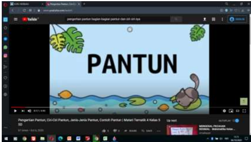
Screenshot video pembelajaran Pantun

https://www.youtube.com/watch?v=OPeSpq3SEsE