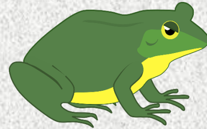
Konsumen tingkat II