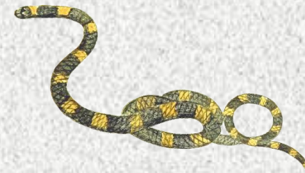
Konsumen tingkat III