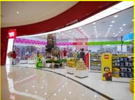
Mall / Super Market