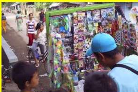
PENJUAL MAINAN KELILING