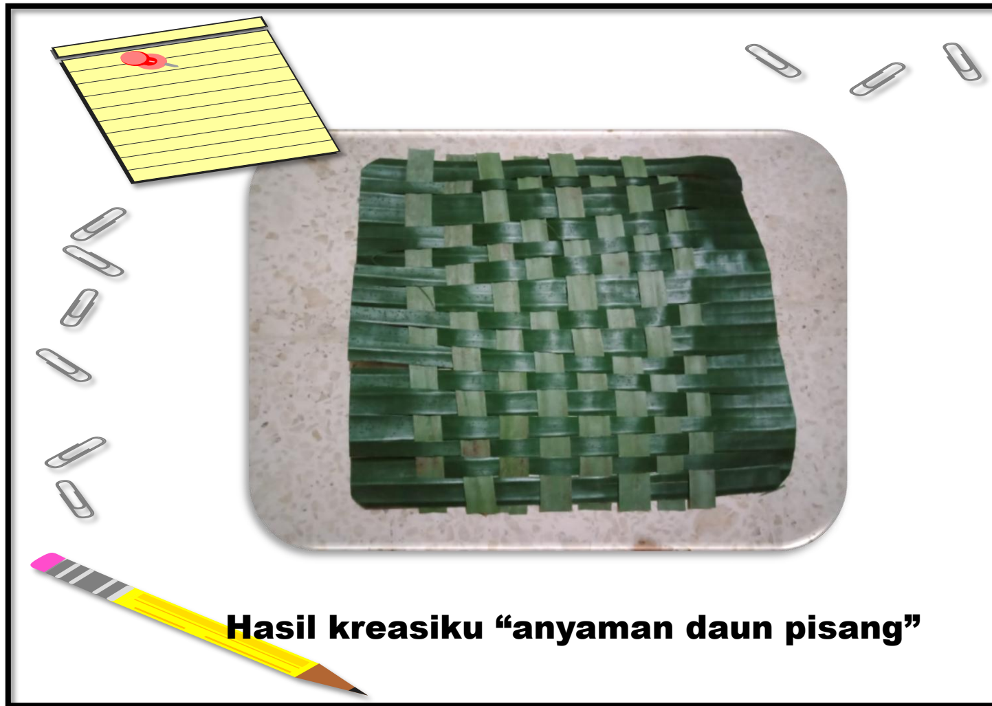
Hasil kreasiku “anyaman daun pisang”