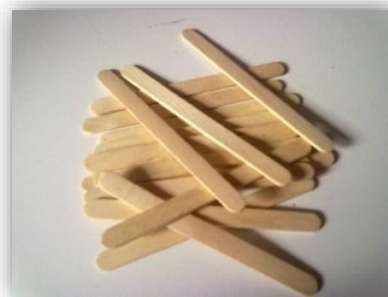
Stik Es Krim