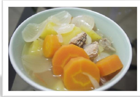
Sayur Sop wortel