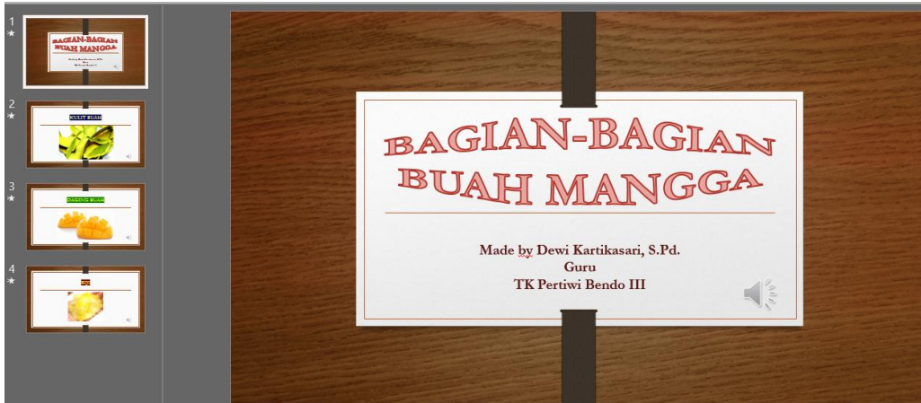
Gambar 2. Video ppt guru tentang bagian-bagian buah mangga

Media Pembelajaran : Video ppt dari Guru yang dikirimkan melalui WA Grup