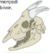
Tengkorak Hewan Herbivor

Kelompok hewan herbivor merupakan hewan yang makanannya berasal dari tumbuhan. Hewan ini memiliki susunan gigi yang khas. Gigi hewan ini terdiri atas gigi seri dan gigi geraham, dan tidak memiliki gigi taring. Gigi seri berada di depan dan tajam. Gigi ini berguna untuk memotong makanan. Sementara itu, gigi geraham berfungsi untuk menghaluskan makanan yang telah dipotong oleh gigi seri. Contoh hewan yang termasuk kelompok ini adalah sapi, kelinci, kerbau, dan rusa.