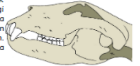
Tengkorak Hewan Omnivor

Kelompok hewan omnivor merupakan kelompok hewan yang makanannya berasal dari tumbuhan maupun hewan lain. Hewan omnivor memiliki susunan gigi tersendiri. Gigi seri, gigi taring, dan gigi geraham hewan ini berkembang dengan baik untuk menyesuaikan dengan makanannya. Gigi seri dan gigi taring digunakan ketika memakan makanan yang berupa hewan lain. Sementara itu, gigi seri dan gigi geraham digunakan ketika memakan makanan berupa tumbuhan. Orangutan, gorila, dan monyet, merupakan beberapa contoh hewan yang termasuk dalam kelompok ini.