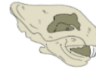
Tengkorak Hewan Karnivor

Kelompok hewan karnivor adalah kelompok hewan yang memakan hewan lain. Sebagian besar hewan yang termasuk di dalam kelompok ini merupakan hewan buas dan liar. Hewan ini harus berburu untuk mendapatkan makanan. Oleh karenanya, hewan ini memiliki gigi taring yang tajam dan kuat. Gigi taring berguna untuk merobek dan mengoyak mangsa. Hewan ini juga memiliki gigi seri yang tajam dan kuat meskipun berukuran kecil. Gigi ini juga berfungsi untuk memotong makanan. Hewan yang termasuk dalam kelompok ini adalah harimau, singa, anjing buaya, dan ular.