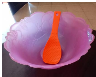
wadah dan centong plastic/ kayu