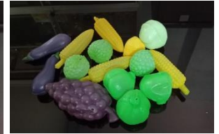
Buah dan sayur plastik

Proses : Mengelompokkan benda berdasarkan jenisnya