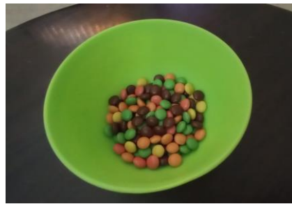
permen warna warni