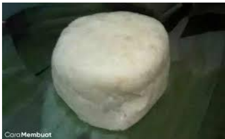
Adonan gethuk lindri