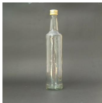
Botol kaca untuk rol