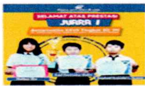
2) Juara Astramatika & Pris...