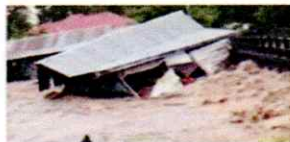
4) Banjir Bandang Soppeng ...