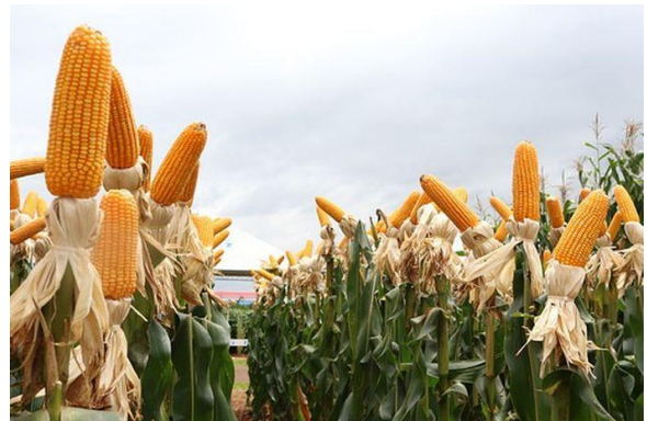
Gambar tanaman jagung