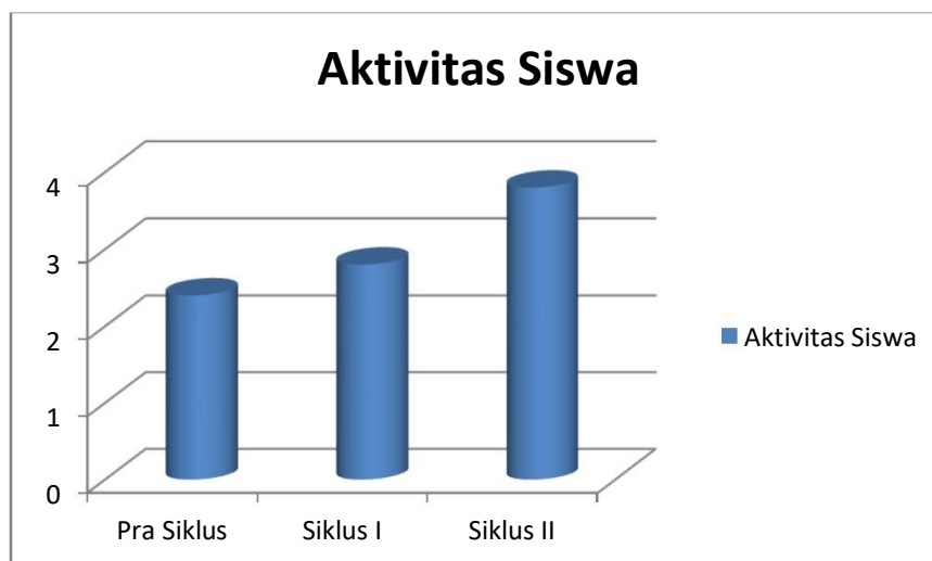
Gambar 2 Grafik Peningkatan Aktivitas Siswa

Berdasarkan Tabel 2 di tinggi, menunjukkan bahwa aktivitas siswa dalam pembelajaran Penjas Orkes pada lompat jauh gaya jongkok di kelas V SD Negeri 0604673 dengan menggunakan alat bantu tali rintangan, menunjukkan peningkatan dari siklus ke siklus. Hal ini terlihat dengan peningkatan rata-rata skor dari 2.4 pada pra tindakan menjadi 2.8 pada siklus I atau dengan kata lain meningkat 0.4 atau 16.66%. Aktivitas siswa dalam pembelajaran makin meningkat pada siklus II dengan peningkatan rata-rata skor menjadi 3.8 atau dengan kata lain meningkat 1.0 atau 40%. Hal tersebut membuktikan bahwa proses pembelajaran Penjas Orkes pada lompat jauh gaya jongkok dengan menggunakan alat bantu tali rintangan dapat meningkatkan aktivitas siswa.