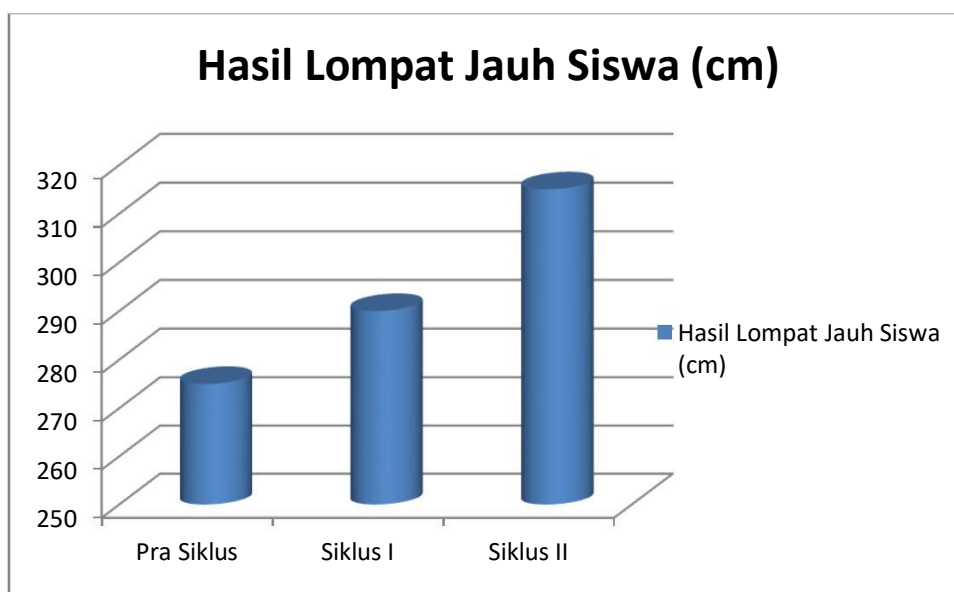
Gambar 3. Grafik Peningkatan Hasil lompatan Siswa

Berdasarkan Tabel 3 di tinggi, menunjukkan bahwa hasil lompatan siswa dalam pembelajaran Penjas Orkes pada lompat jauh gaya jongkok di kelas V SD Negeri 0604673 dengan menggunakan alat bantu tali rintangan, menunjukkan peningkatan dari siklus ke siklus. Hal ini terlihat dengan peningkatan rata-rata hasil lompatan dari 275 cm pada pra tindakan menjadi 290 cm pada siklus I atau dengan kata lain meningkat 15 cm atau 1,5%. Hasil lompatan siswa dalam pembelajaran makin meningkat pada siklus II dengan peningkatan rata-rata hasil lompatan menjadi 314 cm atau dengan kata lain meningkat 24 cm atau 2,4%. Hal tersebut membuktikan bahwa proses pembelajaran Penjas Orkes pada lompat jauh gaya jongkok dengan menggunakan alat bantu tali rintangan dapat meningkatkan hasil lompatan siswa.