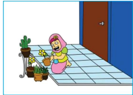
Gambar 2.9 Anak sedang merawat tanaman dalam pot di halaman rumah

4. Ajaran terpuji kepada diri sendiri. Perhatikan ilustrasi gambar berikut.