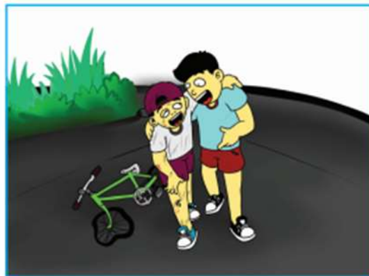
Gambar 2.7 Anak sedang menolong teman yang terjatuh dari sepeda

3. Ajaran terpuji kepada hewan, dan tumbuhan. Perhatikan ilustrasi gambar berikut.