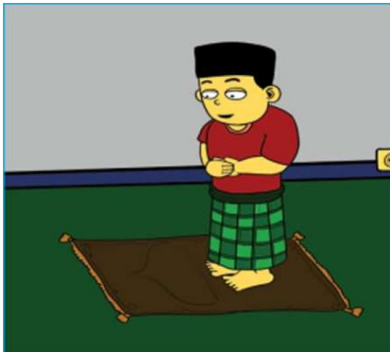
Gambar 2.4 Gambar anak sedang melakukan ibadah

1. Ajaran terpuji kepada Sang Pencipta Allah SwT. Perhatikan ilustrasi gambar berikut!