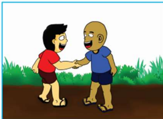
Gambar 2.6 Anak saling bersalaman sesama teman

2. Ajaran terpuji kepada sesama manusia. Perhatikan ilustrasi gambar berikut.