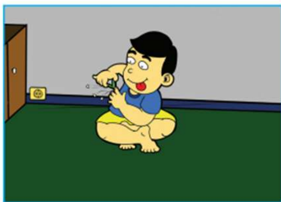
Gambar 2.10 Anak laki-laki sedang memotong kuku

4. Ajaran terpuji kepada diri sendiri. Perhatikan ilustrasi gambar berikut.