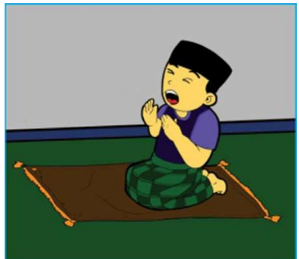
Gambar 2.5 Gambar anak sedang berdoa kepada Allah SwT dengan mengangkat tangan