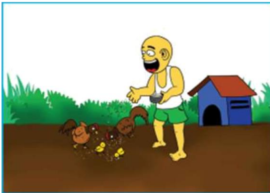
Gambar 2.8 Anak sedang memberikan makanan kepada ayam di halaman rumah

3. Ajaran terpuji kepada hewan, dan tumbuhan. Perhatikan ilustrasi gambar berikut.