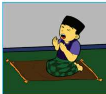
Gambar 2.5 Gambar anak sedang berdoa kepada Allah Swt. dengan mengangkat tangan