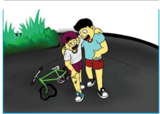
Gambar 2.7 Anak sedang menolong teman yang terjatuh dan sepeda

3. Ajaran terpuji kepada hewan, dan tumbuhan. Perhatikan ilustrasi gambar berikut.