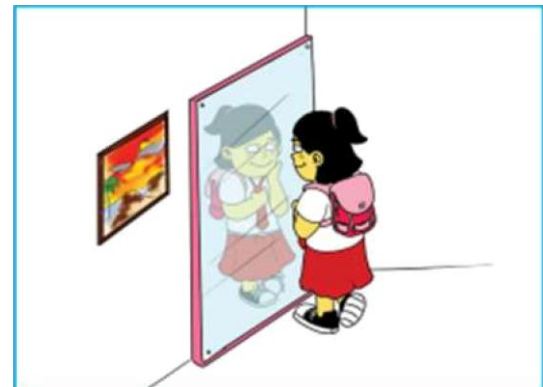
Gambar 2.11 Anak perempuan sedang berhias hendak berangkat ke sekolah