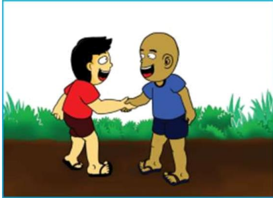
Gambar 2.6 Anak saling bersalaman sesama teman

2. Ajaran terpuji kepada sesama manusia. Perhatikan ilustrasi gambar berikut.