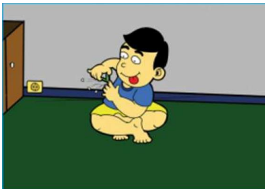
Gambar 2.10 Anak laki-laki sedang memotong kuku

4. Ajaran terpuji kepada diri sendiri. Perhatikan ilustrasi gambar berikut.