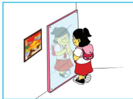
Gambar 2.11 Anak perempuan sedang berhias hendak berangkat ke sekolah