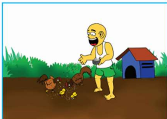
Gambar 2.8 Anak sedang memberikan makanan kepada ayam di halaman rumah

3. Ajaran terpuji kepada hewan, dan tumbuhan. Perhatikan ilustrasi gambar berikut.