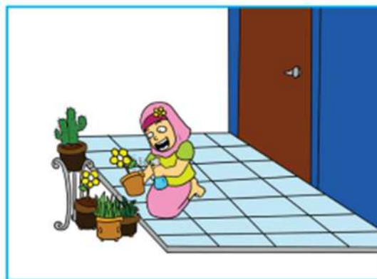
Gambar 2.9 Anak sedang merawat tanaman dalam pot di halaman rumah

4. Ajaran terpuji kepada diri sendiri. Perhatikan ilustrasi gambar berikut.