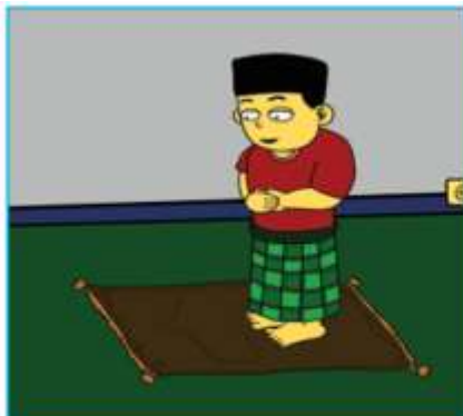
Gambar 2.4 Gambar anak sedang melakukan ibadah salat