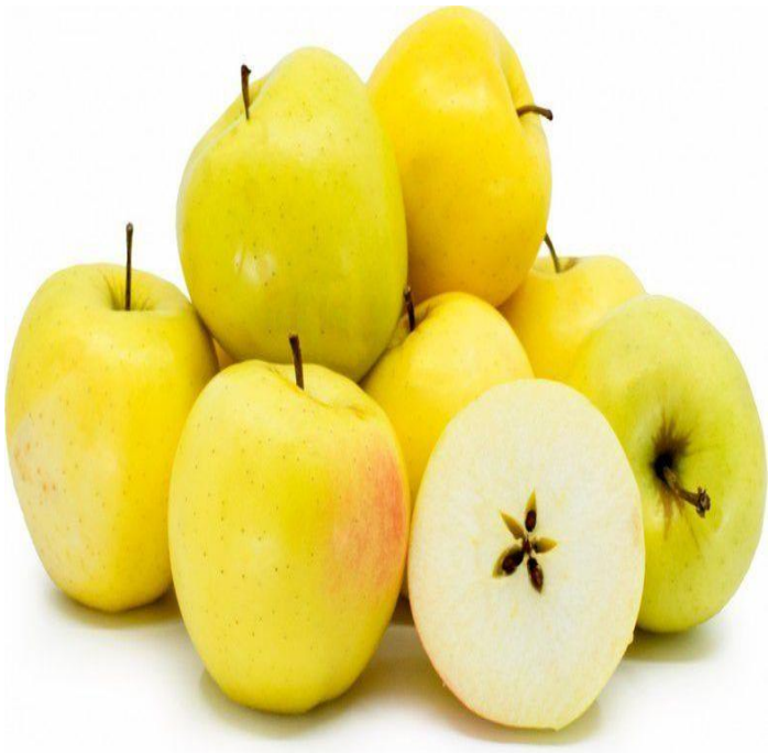
Apel Golden (kuning)