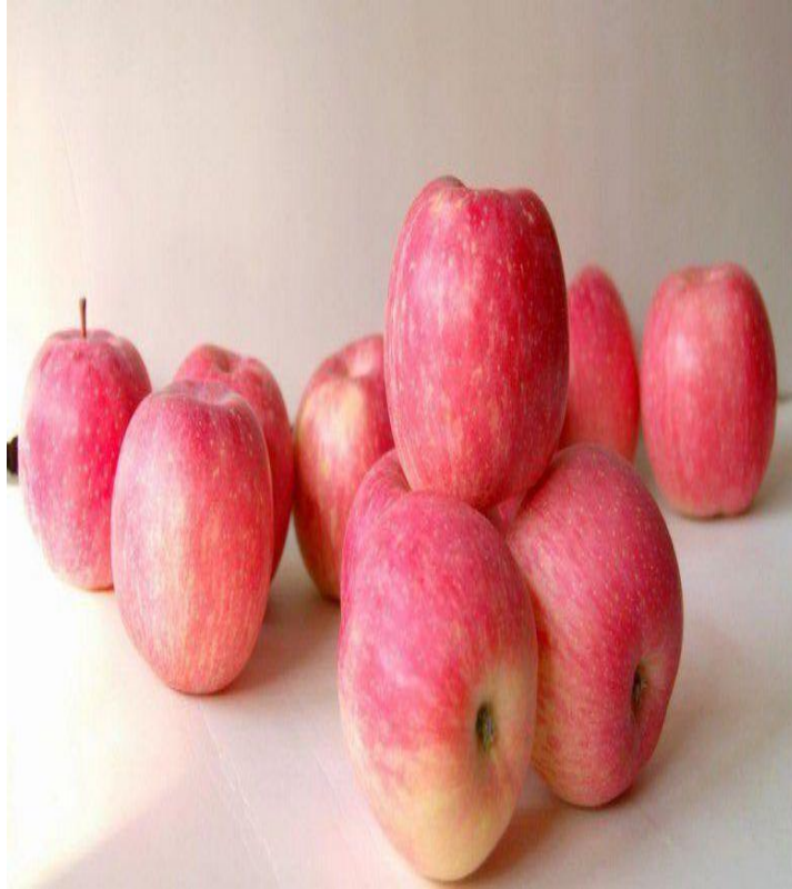
Apel Fuji (Merah)