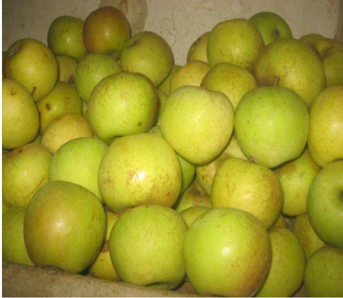
Apel manalagi (hijau)