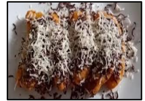
Pisang Keju Coklat