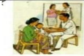
5. PELAYANAN OLEH PETUGAS