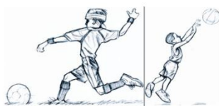
Sumber: Kemdikbud, 2013 Gambar 2.10 Gam- bar ilustrasi dengan bentuk objek manusia.

Tokoh manusia memiliki proporsi yang berbeda sehingga pada saat menggambar kita perlu memperhatikan karakter dan memahami anatominya, agar terlihat lebih wajar dan tidak terkesan kaku.