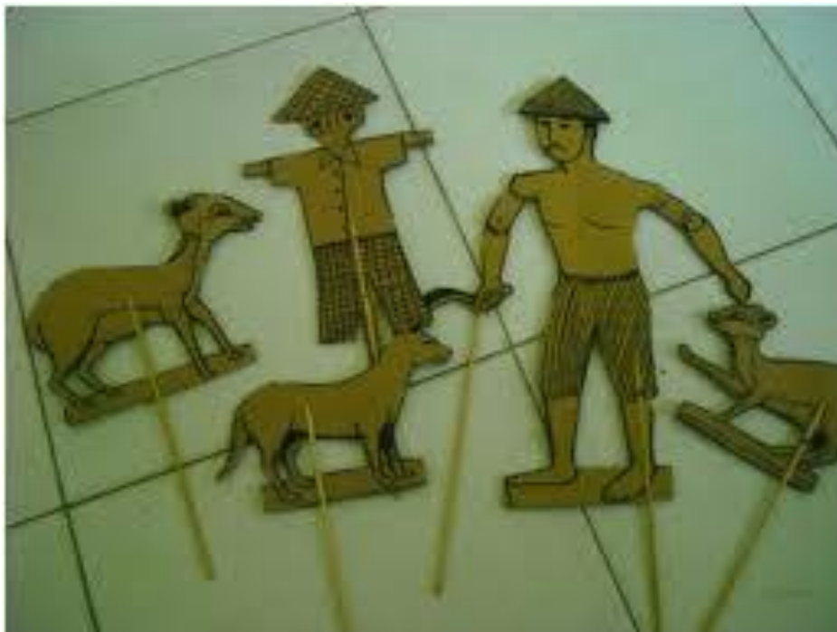
(Ilustrasi: Perkiraan Media Seperti Ini)