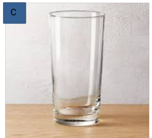
Gambar 1 Piring (A); sendok(B); gelas(C)

Selain media di atas, makanan dan minuman juga menjadi media pembelajaran.