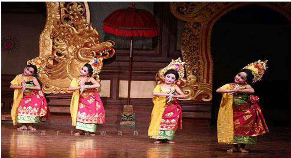
Gambar 4. Pola lantai berbetuk diagonal