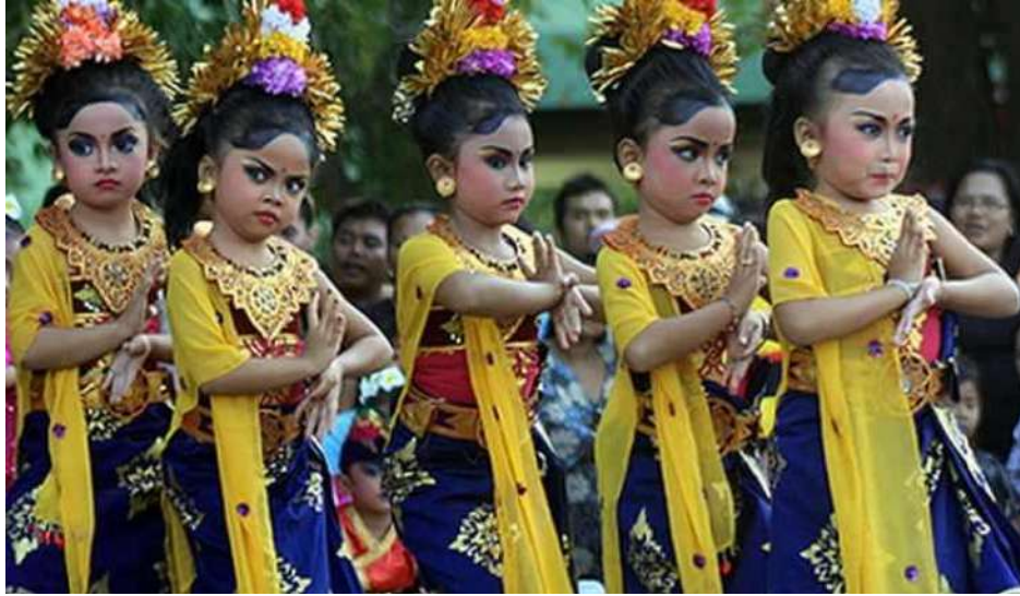
Gambar 5. Pola lantai berbentuk horizontal.