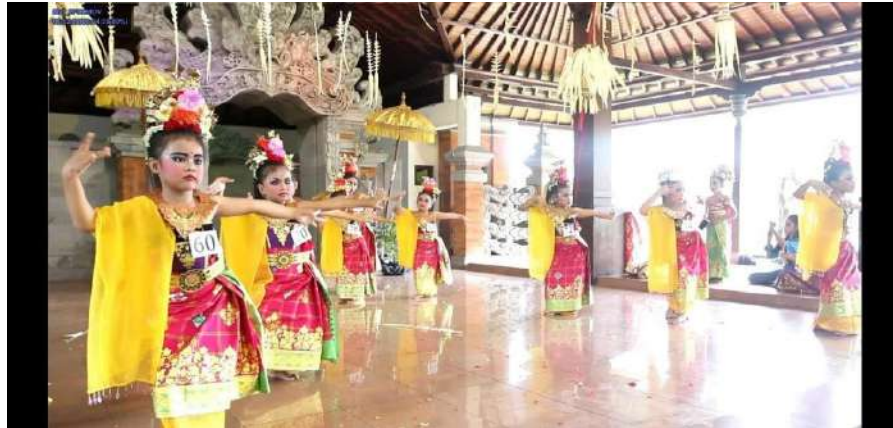
Gambar 3. Pola lantai berbentuk V