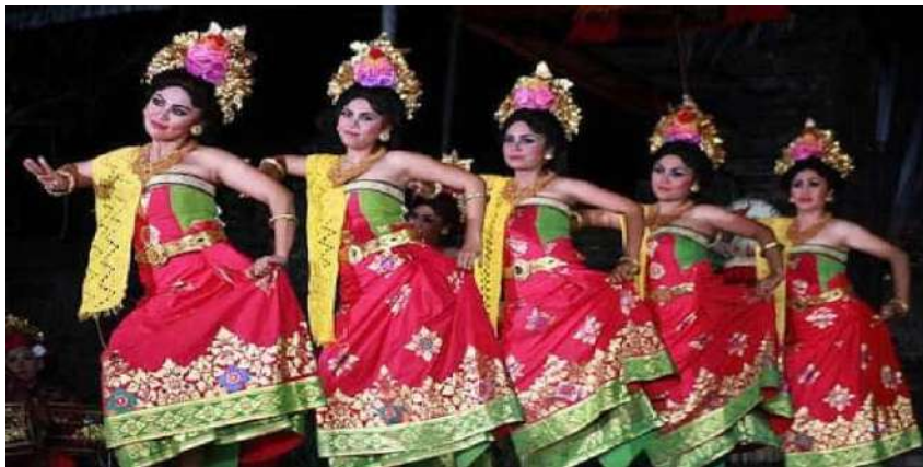
Gambar 2. Pola lantai awal /keluarnya penari