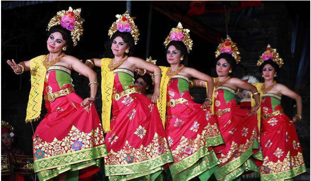
Gambar 1. Tari Puspanjali

kesimpulannya tarian ini memang ditujukan untuk menghormati para tamu yang diibaratkan sebagai bunga.