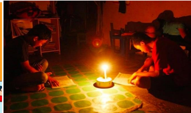
Gambar 3. Perilaku boros listrik dan dampaknya