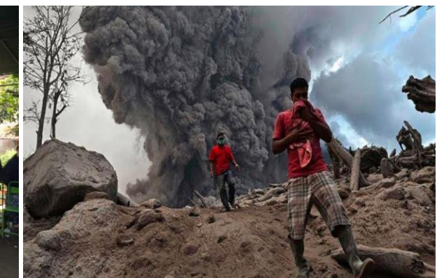
Gambar 8. Peristiwa bencana alam