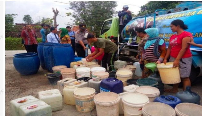
Gambar 4. Perilaku boros air dan dampaknya