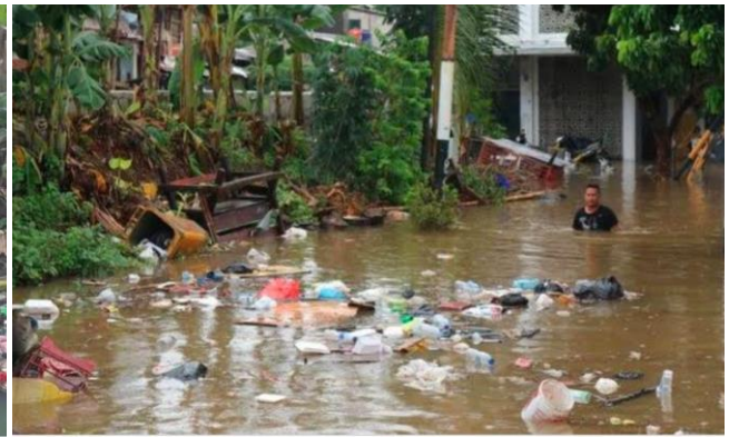
Gambar 2. Banjir dampak membuang sampah di sungai