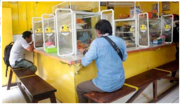
Gambar 6. Aneka usaha dalam bentuk jasa