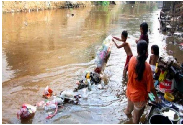
Gambar 1 . Membuang sampah di sungai