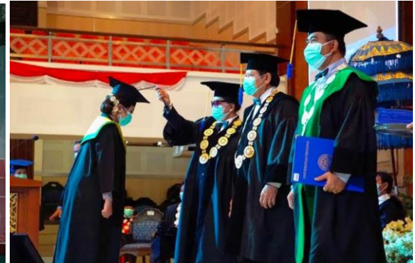
Gambar 7. Perayaan peristiwa yang mengesankan