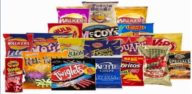
Gambar 5. Aneka produk usaha