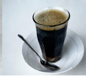
kopi tanpa gula