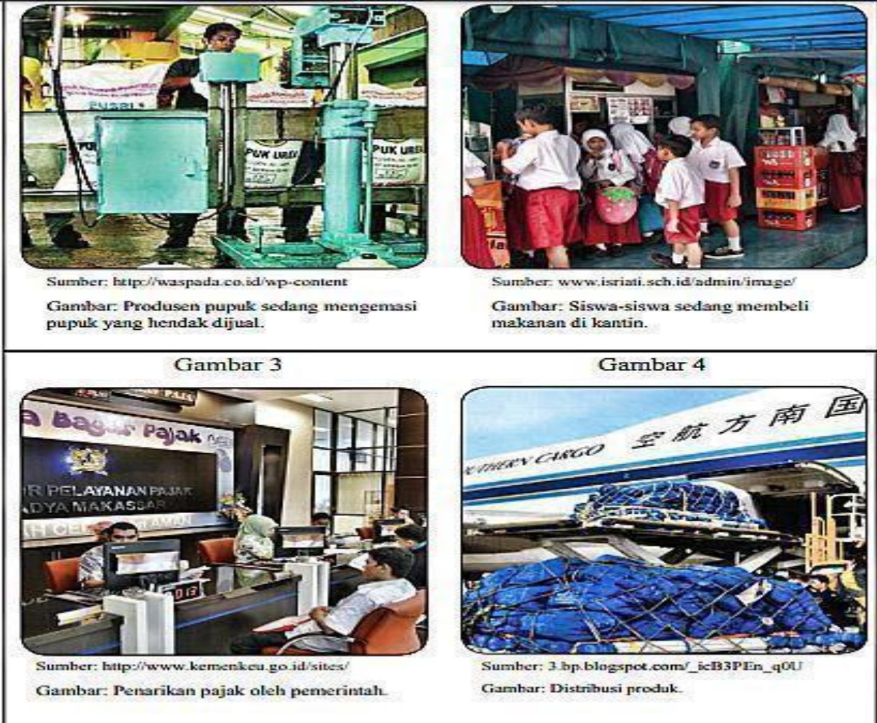
Gambar 3.1 Pelaku ekonomi.

1. Setelah membaca buku paket dan gambar diatas isilah tabel dibawah ini !