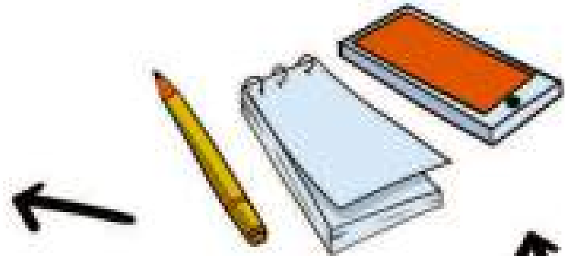
4. Menggunakan alat bantu