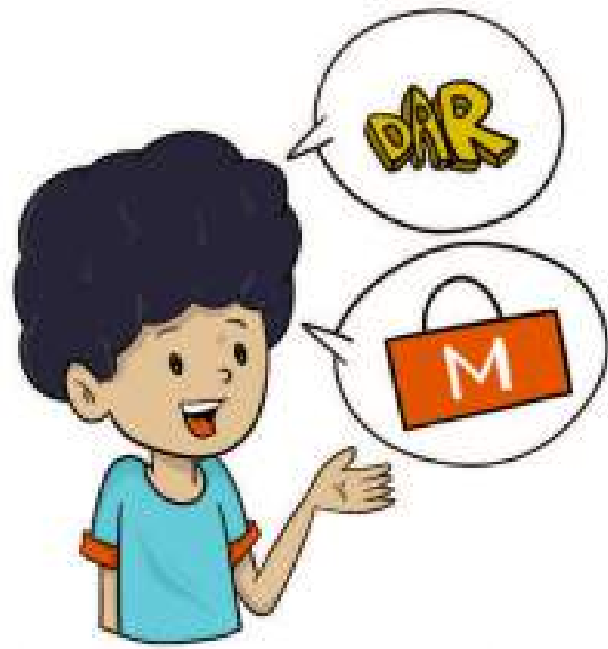
3. Mengamati bentuk dan pola