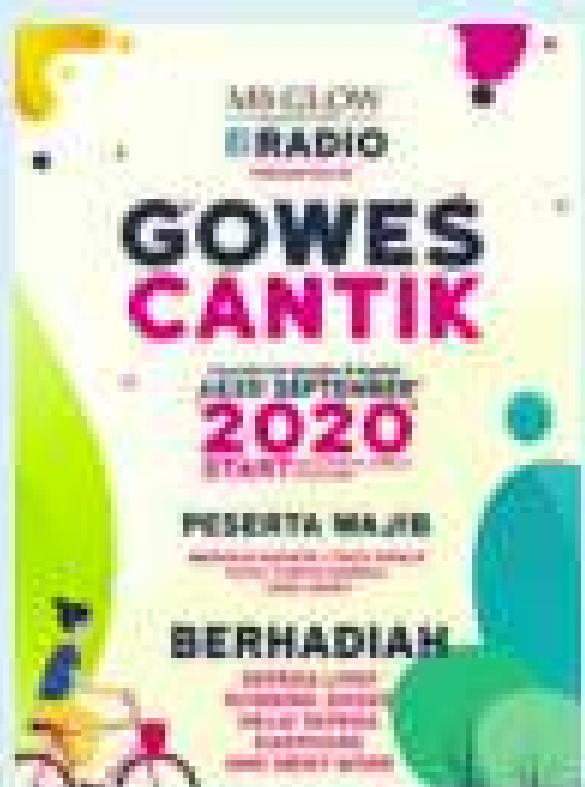
Gambar 3.1 Contoh tipografi pada poster

Tipografi adalah seni menata huruf dan mengatur penyebarannya pada ruang yang tersedia. Tipografi sering dapat kita temukan dimana-mana dan menjadi bagian penting dalam mendesain khususnya desain grafis. Dalam tipografi terdapat proses mengenal jenis-jenis huruf dan juga ukuran huruf sebelum memasuki tahap mengatur penyebaran huruf pada ruang yang tersedia yang banyak kita lihat di dalam poster, cover buku, kemasan, dll.