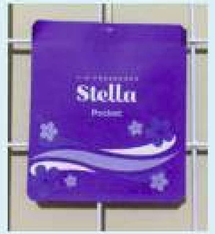
Gambar 3.3 Contoh tipografi pada kemasan