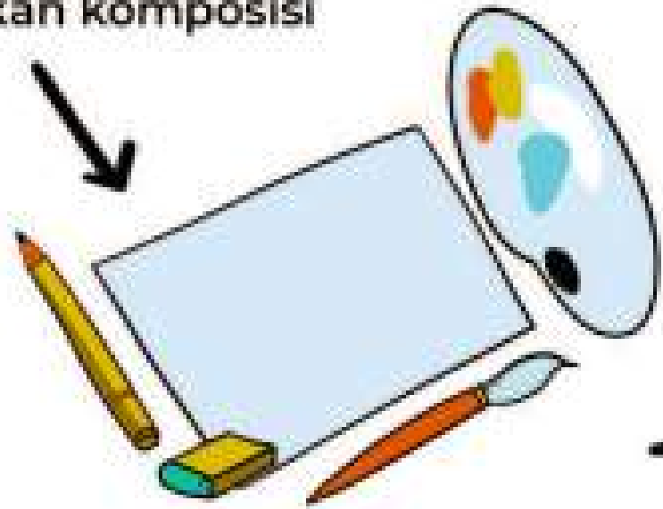
2. Alat yang dibutuhkan