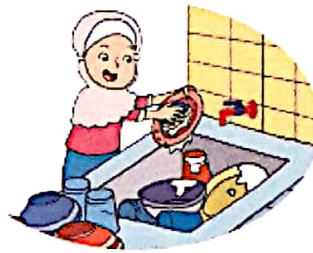
Mematikan keran saat menyabuni piring.