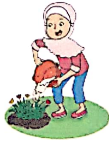
Siti menyiram tanaman menggunakan air bekas cucian beras.