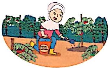
Menaburkan kompos daun di sekitar tanaman. Kompos akan menyimpan air lebih lama.