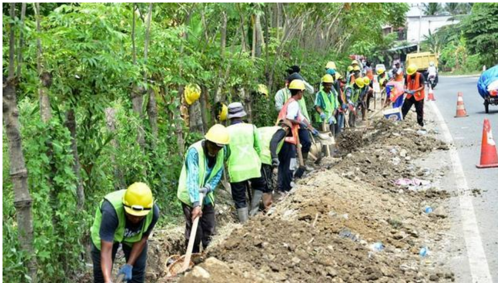
Proyek kegiatan bersifat Padat Karya dan bersifat manual