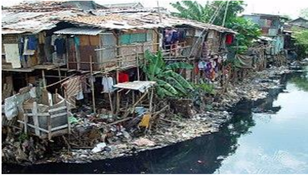
Kemiskinan dan Permasalahan Limbah Lingkungan