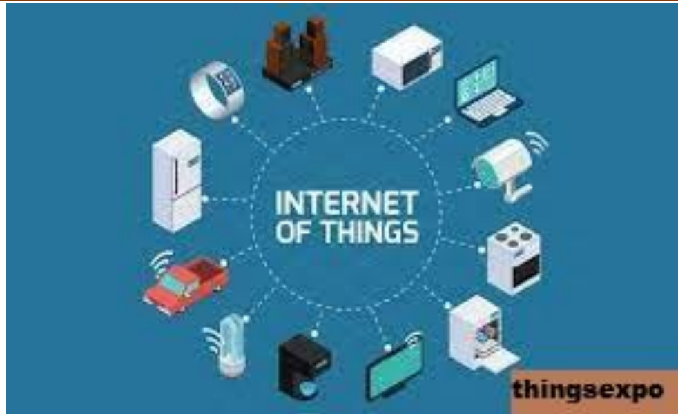
Optimalisasi Penggunaan Internet dalam Kehidupan