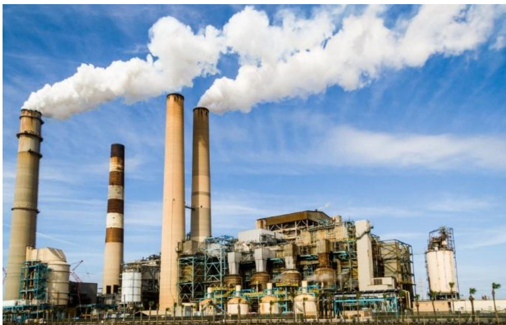
Pengelolaan Limbah yang belum Ramah Lingkungan