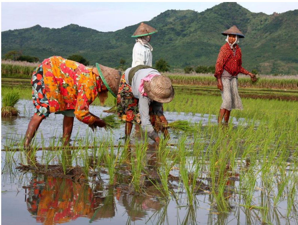
Aktivitas Pertanian di negara berkembang