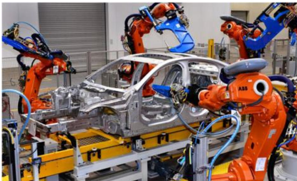
Teknologi Modern dengan Robot dalam Kegiatan Assembling (Perakitan)