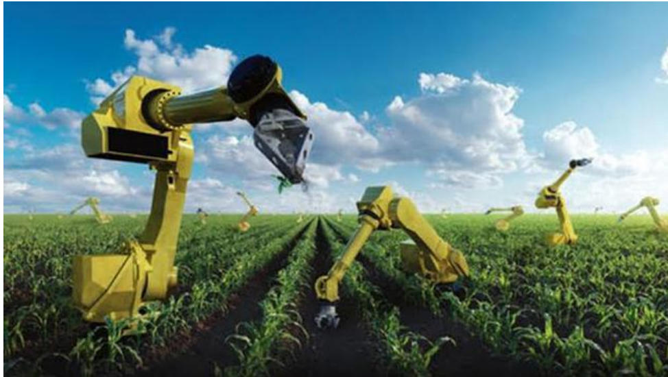
Aktivitas Pertanian di negara maju