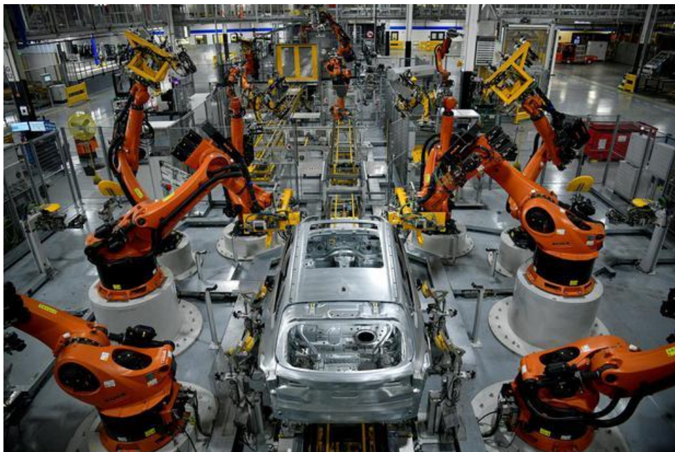
Kegiatan Industri secara Modern