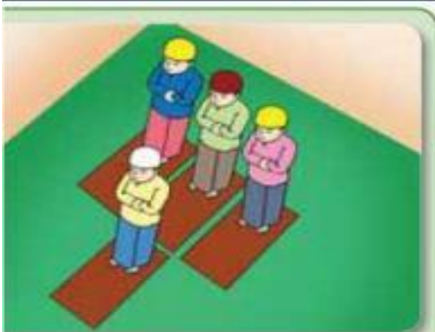
Imam dan tiga makmum