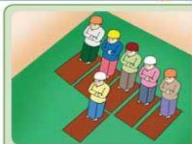
Imam dan lima makmum