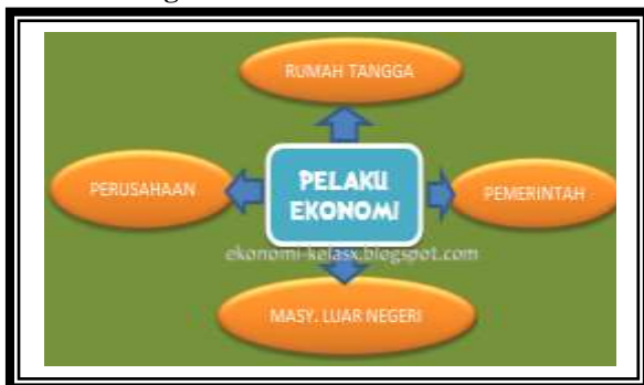
Gambar – gambar Pelaku –Pelaku Ekonomi.