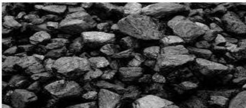
14 Manfaat Batu Bara Bagi Kehidupan Manusia S... rumusrumus.com