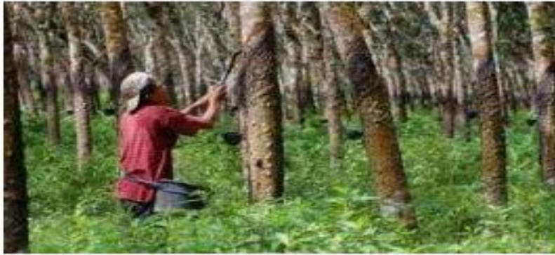
Contoh Sumber Daya Alam Hutan - SouthPort... southportevents.org