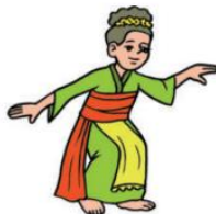
Tari Jaipong dari Jawa Barat