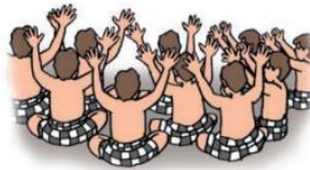
Ada tari Kecak dari Bali