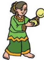
Tari Piring dari Padang