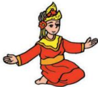
Tari Tanggai dari Palembang