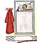
se laver / prendre une douche