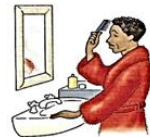
se peigner / se coiffer