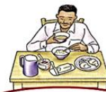
prendre le petit déjeuner