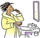
se brosser les dents