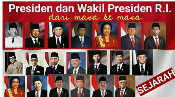
Gambar Presiden dan Wakil Presiden RI