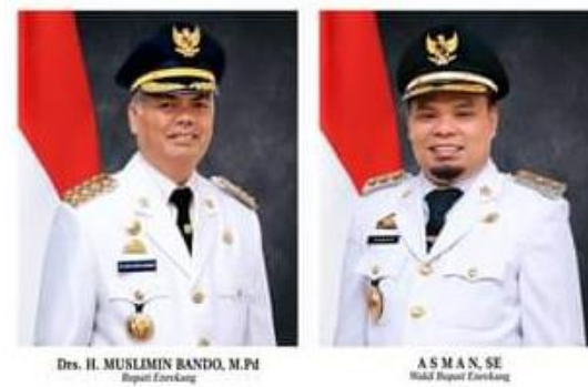
Gambar Bupati dan Wakil Bupati Enrekang