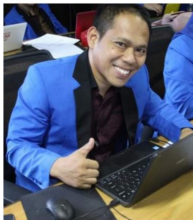
Gambar Kepala SDN 168 Sumbang Kabupaten Enrekang